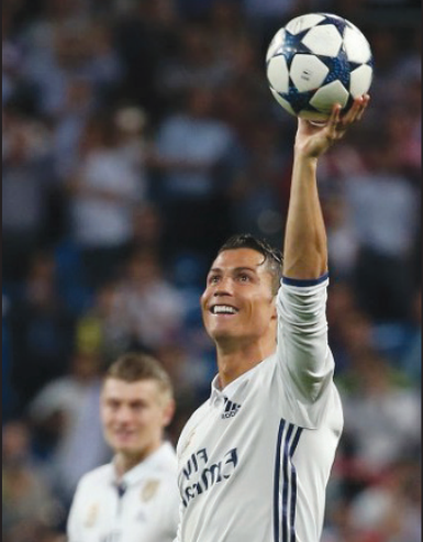
شاکردان آنچولتی می‌دانستند که برای سلامت عبور کردن از جهنم برنابو نیاز به گلزنی دارند. آن‌ها از همان ثانیه نخست کار را تهاجمی آغاز کردند و کم کم به صورت کامل بر بازی مسلط شدند و بازی مالکانه خود را به نمایش درآوردند. نکته حائز اهمیت در این بین شد حملات تند و تیز خطرناک مادریدی‌ها بود. نخستین موقعیت جدی این دیدار روی حرکت لایا و ریبیری از سمت چپ خط دفاعی ژال مادرید به دست آمد. پاس دیدنی آلبا درون محوطه به ریبیری

رسید و پاس در عرض ریبیری به تیاگو رسید، اما ضربه پای چپ تیاگو از دون شش قدم در آستانه ورود به دروازه به بدن مارسلو برخورد کرد و برگشت و در ادامه نیز ضربه والی شکل روین با اختلافی کم به بیرون رفت. بایرنی‌ها به شدت حمله خود را ادامه دادند و در ۱۵ دقیقه اول بارها صاحب ضربه کتر شدند. در ۲۰ دقیقه اول بازی بایرن کاملاً بر بازی مسلط بود و از جناحین حملات زیادی را ترتیب داد. دقیقه ۲۰ به بعد ژال مادرید چند حمله روی دروازه بایرن انجام داد. شوت پای راست دقیق کارواخال با واکنش دیدنی تویر همراه شد. دقایقی بعد روی دفع ناقص تویر شوت بایرنکنان ژال مادرید از روی خط دروازه برگشت داده شد. در ادامه بازی متعادل تر شد و هر دو تیم حملات جدی تری را ترتیب دادند. دقیقه ۳۳ روی اشتباه مدافعان بایرن درون محوطه، توپ پشت محوطه به کروس رسید و ضربه فنی او با اختلاف به بیرون رفت. دقایقی بعد روی یک پاس در عقب فوق‌العاده رونالدو در حالت تک به تک با تویر قرار گرفت، اما تویر به زیبایی توپ را برگشت داد. لحظاتی بعد نیز روی یک حرکت ترکیبی شوت کروس می رفت تا دروازه نویر را باز کند، اما هولس با تکلی دیدنی توپ را برگشت داد. در نهایت نیمه اول با تساوی ۰-۰ به پایان رسید. نیمه دوم نیمه دوم بازی نیز جذاب آغاز شد و هر دو تیم تهاجمی کار کردند. اولین موقعیت جدی در نیمه اول روی شوت ایسکو در دقیقه ۴۷ به دست آمد، اما شوت زمینی ایسکو با اختلاف