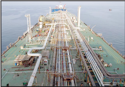
از تأمین این موارد، روند انجام مناقصه و انتخاب پیمانکار با کندی روبرو شد.

به گفته سقایی، به دلیل اهمیت این طرح، نوع نفت انتقالی و عبور آن از مناطق گرمسیر با میانگین درجه حرارت بالای ۵۰ درجه در سال، جنس لوله های استفاده شده اهمیت بسیاری دارد و برای انتخاب آن زمان زیادی اختصاص یافت؛ به طوری که یک گروه تخصصی از اساتدان دانشگاهی و کارشناسان صنعت نفت در یک برنامه مطالعاتی یک ساله جنس لوله مورد نیاز (انوع نایس) را شناسایی و معرفی کردند. در گزارش ۱۰ صفحه ای گروه کارشناسان، همه جزئیات مربوط به جنس ورق لوله، میزان خوردگی و مقاومت فلز مورد استفاده در مقابل گرما و ترکیبات نفت خام صادراتی لحاظ شده است.