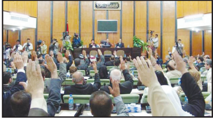
پارلمان اقلیم کردستان عراق روز جمعه ۲۴ شهریور (۱۵ سپتامبر) به رغم مخالفت تهران، آنکارا، دمشق، خصوصاً بغداد و حتی قدرت‌های بزرگ، رای به برگزاری همه پرسی استقلال داد، در این رای‌گیری کرکوک نیز با اربیل هم‌نواست.

را در این کشور رقم بزنند. پس از آنکه گروه داعش طی دو سال گذشته اکثر مناطق تحت کنترل خود را در عراق از دست داد، اکنون اختلاف دیرین دولت مرکزی عراق و کُردها بار دیگر اوج گرفته است. نیروهای کرد از تابستان سال ۲۰۱۴ میلادی کنترل کامل استان کرکوک را در اختیار دارند اما دولت مرکزی عراق و دولت اقلیم کردستان بر سر حکمرانی بر این استان نفت خیز اختلاف‌نظر دارند. پیش‌مرگه‌های کرد در حالی کنترل استان کرکوک را به دست گرفتند که به دنبال عقب‌نشینی ارتش عراق در برابر تهاجم گروه داعش بیم آن می‌رفت جنگجویان این گروه افراطی استان کرکوک را تصرف کنند. بغداد سرسختانه با برگزاری استقلال اقلیم کردستان عراق مخالف است. پارلمان عراق ضمن مخالفت با این همه‌پرسی، برگزاری آن را