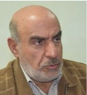
حسین کمالی، دبیرکل حزب اسلامی کار:

وی با اشاره به اینکه ولایت فقیه، رمز استمرار شیعه است، گفت: پهلوی دوم، مبانی غرب‌گرایی را در دانشگاه تدریس کرد تا مبنای جوانان فارغ التحصیل کرده، تمدن غرب باشد، با پیروزی انقلاب و جنگ تحمیلی، زنجیره غرب‌گرایی در کشور شکسته شد و مردم در جنگ دریاقتند که می‌شود با نه گفتن به غرب در جنگ پیروز شد.