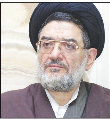
اسحاق جهانگیری معاون اول رئیس‌جمهور

معاون اول رئیس‌جمهور در پیامی به حجت الاسلام سید علی اکبر محتشمی‌پور، درگذشت مادر وی را تسلیت گفت.