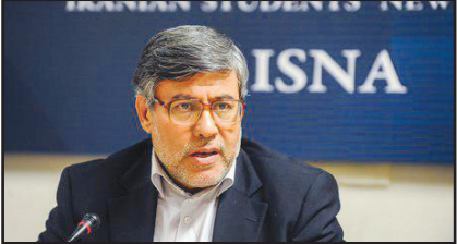
رئیس سازمان پژوهش‌های علمی-کاربردی خراسان جنوبی در حال حاضر هزار فارغ‌التحصیل و ۲۱ هزار دانشجوی دارد که در ۷۰ رشته تحصیل می‌کنند