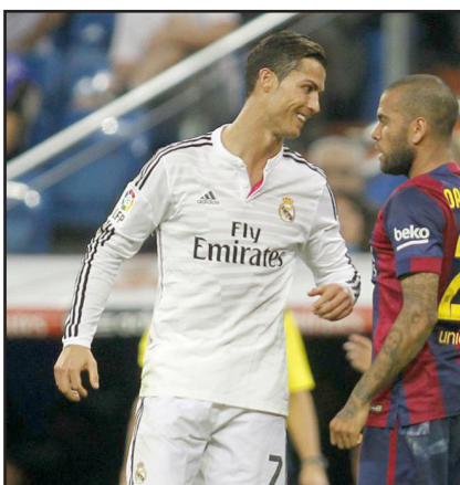
قهرمان جام کنفدراسیون ها شده است؛ اما با این تفاسیر، دنی آوس در بین جام‌گیرترین بازیکنان، اول نیست و هموطن او مکسول، کوپا دل ری، ۴ سوپرکاپ اسپانیا، ۴ لیگ قهرمانان، ۳ سوپرکاپ اروپا و ۳ بار جام باشگاه های جهان شد تا آماری تاریخی را به ثبت برساند. در تیم ملی برزیل هم علیرغم دست نیافتن به توفیقی هم رده دوران باشگاهی، آوس تا به حال دو بار فاتح کوپا آمریکا و ۲ بار

چیزی مانده بود تیم مورینیو در آخرین ثانیه حذف شود و سلتاویگو در اولدترافورد جشن صعود بگیرد. منچستر یونایتد و آژاکس در پایان بازی‌هایی نفس‌گیر موفق شدند به فینال لیگ اروپا برسند و انتظار می‌رود دو قهرمان سابق اروپا در فینال استکهلم نمایش جذابی خلق کنند. خطر از بیخ گوش شیاطین می‌بینینی میشد منچستر یونایتد در بعد از پیروزی یک راه دور دایی در فوتبال ایران بود. مردی که اولین قهرمانی‌اش با عنوان مربی - بازیکن در سایپا به‌دست‌آمده، زمانی که از روی نیکمت بلند می‌شد و نتیجه را عوض می‌کرد. تصدیق می‌کنید که با این روحیه هدایت تیم از راه دور چه کار دشواری است. دایی با گل سجاد شهباززاده موفق شد عنوان قهرمانی جام حذفی را تصاحب کند و پس از پایان این بازی رسماً جدایی